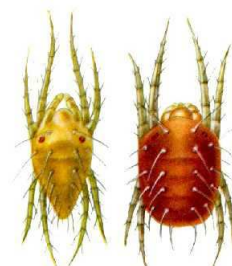
црвена воћна гриња ( Panonychus ulmi )