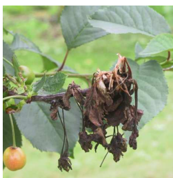
монилиозе коштичавог воћа ( Monilia sp. )