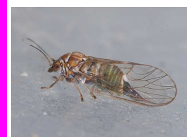
крушкина бува ( Cacopsylla sp. )