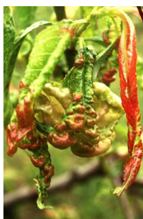
коврџавост листа брескве ( Taphrina deformans )