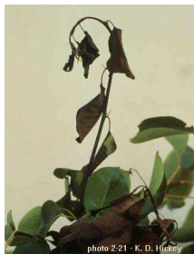
бактериозна пламењача јабуке и крушке ( Erwinia amylovora )