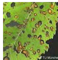
шупљикавост лишћа коштичавог воћа ( Clasterosporium carpophilum (Stigmia carpophila) )