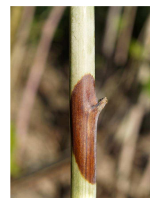
љубичаста (кестењаста) пегавост малине ( Dydimella applanata )